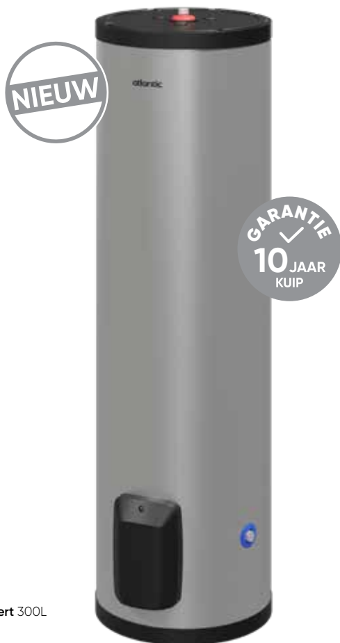
Inox Expert 300L

Inox Expert is robuust en duurzaam en biedt een oplossing voor de intensieve warmwaterbehoefte van de beroepsgebruiker. De boiler is geschikt voor alle soorten water en veeleisende toepassingen.